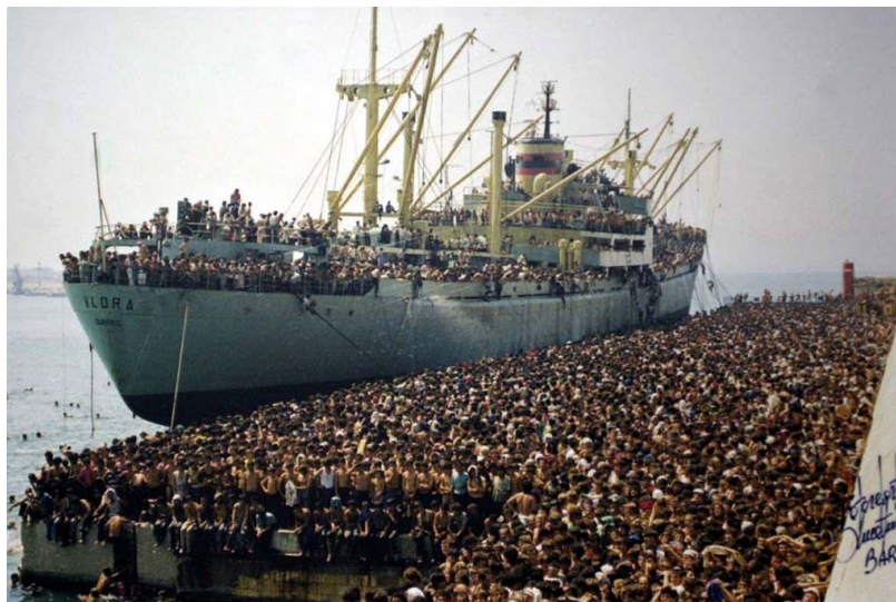
Lod' s afričany v italském přístavu